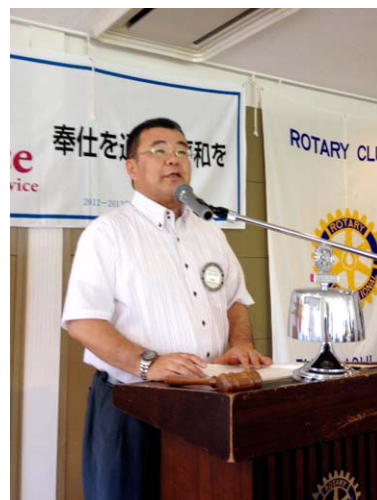
職業奉仕委員会報告、大家会員